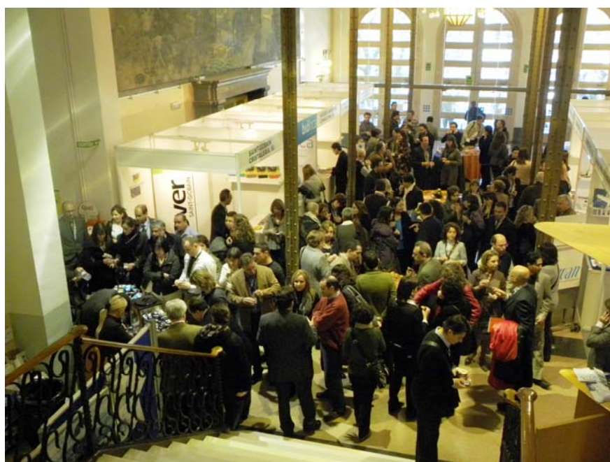
Foto 8: Aspecto del vestíbulo de la Escuela de Ingeniería de Terrassa durante una pausa dedicada a la visita de posters y stands