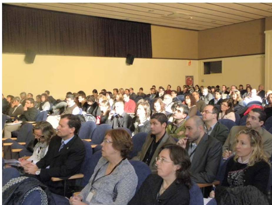
Foto 2: Vista general de la sala de actos de la Escuela de Ingeniería de Terrassa en la sesión de apertura del congreso.